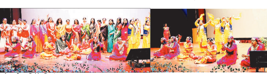
कार्यक्रम की प्रस्तुति देते महिलाएं।