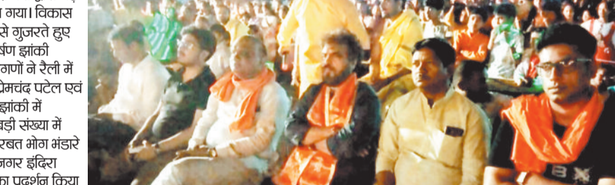
दीपका में मनाई गई हनुमान जयंती।

औद्योगिक नगरी कोरबालांचल क्षेत्र दीपका में हनुमान जयंती पूर्व को ही धूमधाम के साथ मनाया गया। हनुमान जयंती के अवसर पर औद्योगिक नगरी कोरबालांचल क्षेत्र दीपका में श्रद्धालुओं में अर्पण श्रद्धा देखने को मिली। जिसके निमित्त हनुमान मंदिर में प्रातः से सुन्दर कांड का पाठ रामायण हनुमान चालीसा भजन एवं संकीर्तन करते हुए सुबह से ही श्रद्धालु भाव भक्ति में लगे रहे एवं भगवान जी बजरंगवली की पूजा अर्चना की गई। जिसमें नगर के प्रतिष्ठित व्यापारी एवं आम नागरिकों का नगर को सजाने एवं मंदिर में भोग भंडारे में विशेष योगदान देते हुए भंडारे का आयोजन कर भोग प्रसाद वितरण किया गया। जिसमें दीपका नगर एवं पूरे क्षेत्र के कॉलोनीवासी मंदिर में पूजा अर्चना की। मंदिर के मुख्य पुजारी ने क्षेत्रवासियों के लिए सर्वे वंचित व्यक्तियों एवं वंचित बिरादरियों के उद्देश्य से श्रद्धालुओं के लिए सुख शांति और समृद्धि की कामना की।