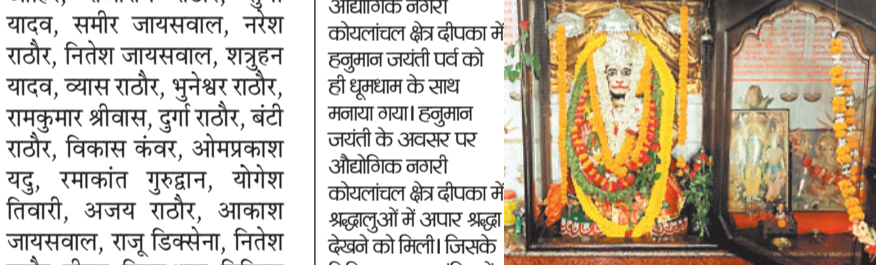
रजगामार में मनाया गया हनुमान जन्मोत्सव।