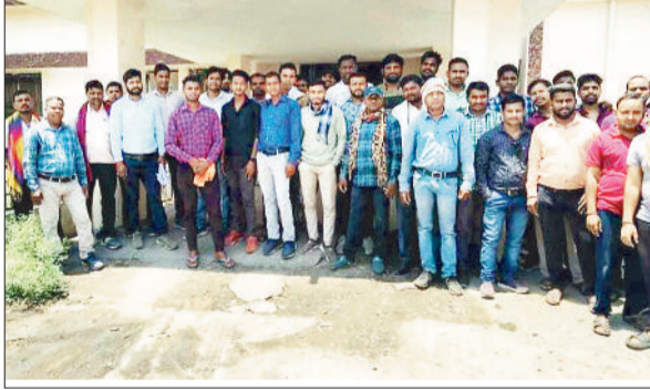
विद्युत विभाग के कार्यालय में प्रदर्शन करते ठेका कर्मी।

बुधवार से सब स्टेशन कर्मी हड़ताल पर चले गए हैं। ठेकेदार ने एक महीने का वेतन जरूर डाला है लेकिन कर्मी अपनी मांगों को लेकर हड़ताल पर डटे हैं।