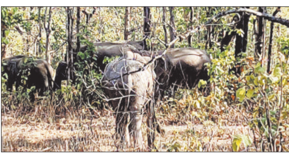
एनएच के पास विवरण करता हाथियों का झुंड।

जिले में हाथियों का उत्पात थमने का नाम नहीं ले रहा है। एक समय ऐसा था कि कोरबा वनमंडल में महज 5 से 6 हाथी ही नजर आते थे। दो दशक बीत जाने के बाद अब लगभग 100 हाथी अपना ठिकाना बना चुके हैं। मौजूदा स्थिति में 89 हाथी कोरबा और कटघोरा के जंगल में डेरा डाले हुए हैं। जिससे दिन और रात क्षेत्र में खतरा मंडरा रहा है और रात क्षेत्र में खतरा मंडरा रहा है और रात क्षेत्र में खतरा मंडरा रहा है। खासतौर पर पिछले कई वर्षों से 49 हाथी कटघोरा वनमंडल में ही जमे हुए हैं। अब तो हाथियों के झुंड हाईवे को ही अपना स्थाई ठिकाना बना चुके हैं। कटघोरा वनमंडल के केंद्र नगर रेंज में 49 हाथी अलग-अलग झुंड में विभक्त होकर लगातार