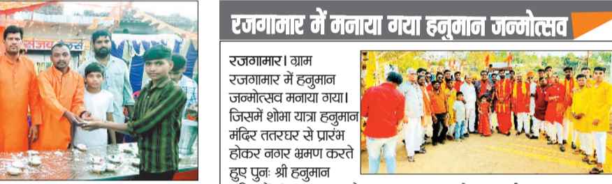
प्रसाद वितरण करते श्रद्धालु।