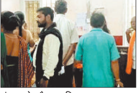
हंगामा के दौरान परिजन।

जिला मेडिकल कालेज अस्पताल में उस वक्त हड़कंध मच गया जब ड्रिप लगाने के दौरान आनाकानी की जाने लगी। मरीज के द्वारा लगातार विरोध किए जाने से आक्रोशित वाई ब्याय ने मरीज को तमाचा जड़ दिया। वाई ब्याय की इस करतूत को सुरक्षा कर्मी व मरीज की पत्नी देख रही थी। घटना