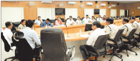
बैठक में निर्देश देते कलेक्टर।

कलेक्टर एवं जिला निर्वाचन अधिकारी अजीत वसंत ने बुधवार को कलेक्टर सभाकक्ष में लोकसभा निर्वाचन के तैयारियों के संबंध में अधिकारियों की समीक्षा बैठक ली। उन्होंने मतदान केन्द्रों की स्थिति,