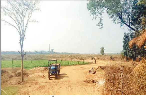
कुदुरमाल घाट के पास जब ट्रैक्टर।

अवैध परिवहन करते हुए पांच ट्रैक्टर को किया गया जप्त