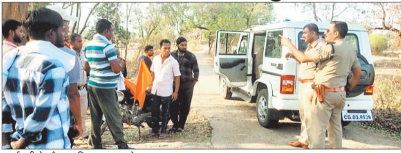
कार्यवाही के दौरान पुलिस व अन्य लोग।